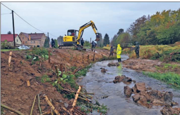
Bereits im nächsten Jahr werden hier die Gehölze austreiben und einen naturnahen Ufersaum bilden.

Dieser Text entstand in Zusammenarbeit der Fachberaterinnen und Fachberater Gewässer des Landesamtes für Umwelt, Landwirtschaft und Geologie und der unteren Wasserbehörde des Landkreises.